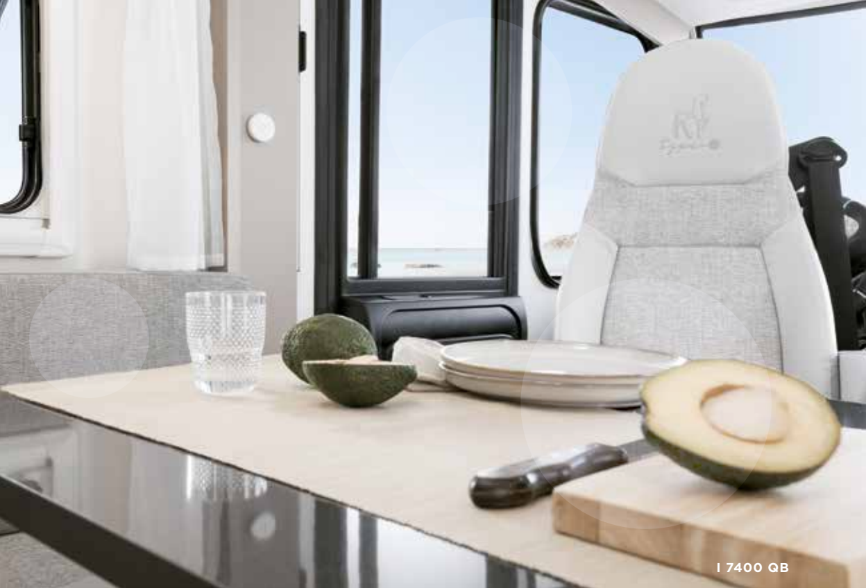
I 7400 QB