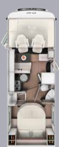
I 6900 QB