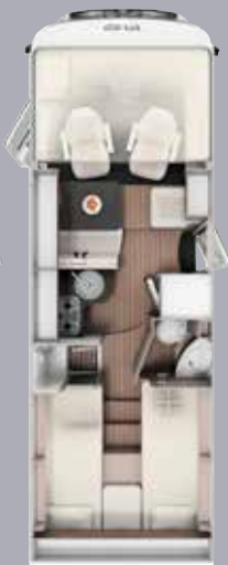
I 7400 SB