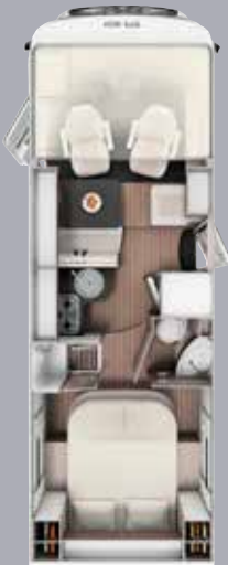
I 7400 QB