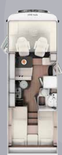
I 6900 SB