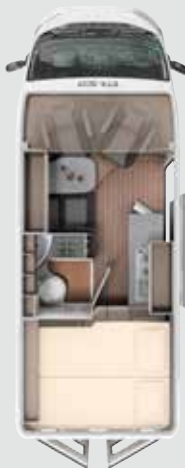
CV 600 BB