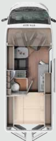
CV 600 DB